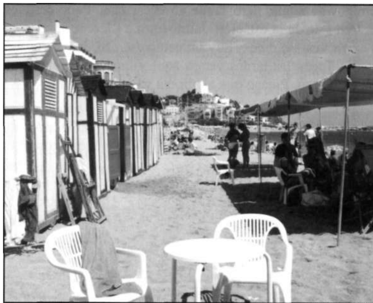
Playa de San Pol