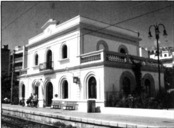
Estación de San Pol

-Ya ves -le dice-. Soy un estúpido... Sí, lo sé, soy un tonto. Todas las tardes vengo aquí y miro a la gente que baja del tren. Pienso que algún día va a bajar Sonia.