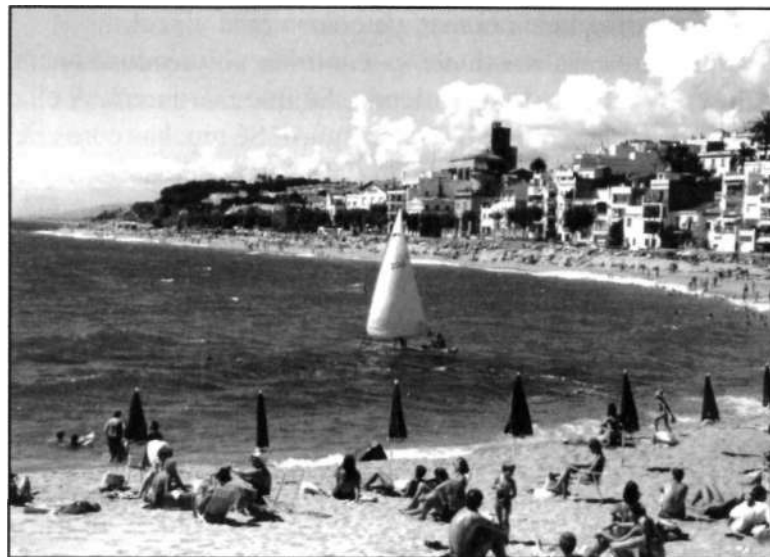
Playa de San Pol

-Hay un chico. Lo sé por una amiga de Sonia. Este chico sabe algo. Es un "okupa", un "squatter". Ya sabes, estos jóvenes que se van a vivir a casas que no son suyas, casas en las que no vive nadie... El chico se llama Toni. Toni Izquierdo. ¿Lo conoces?